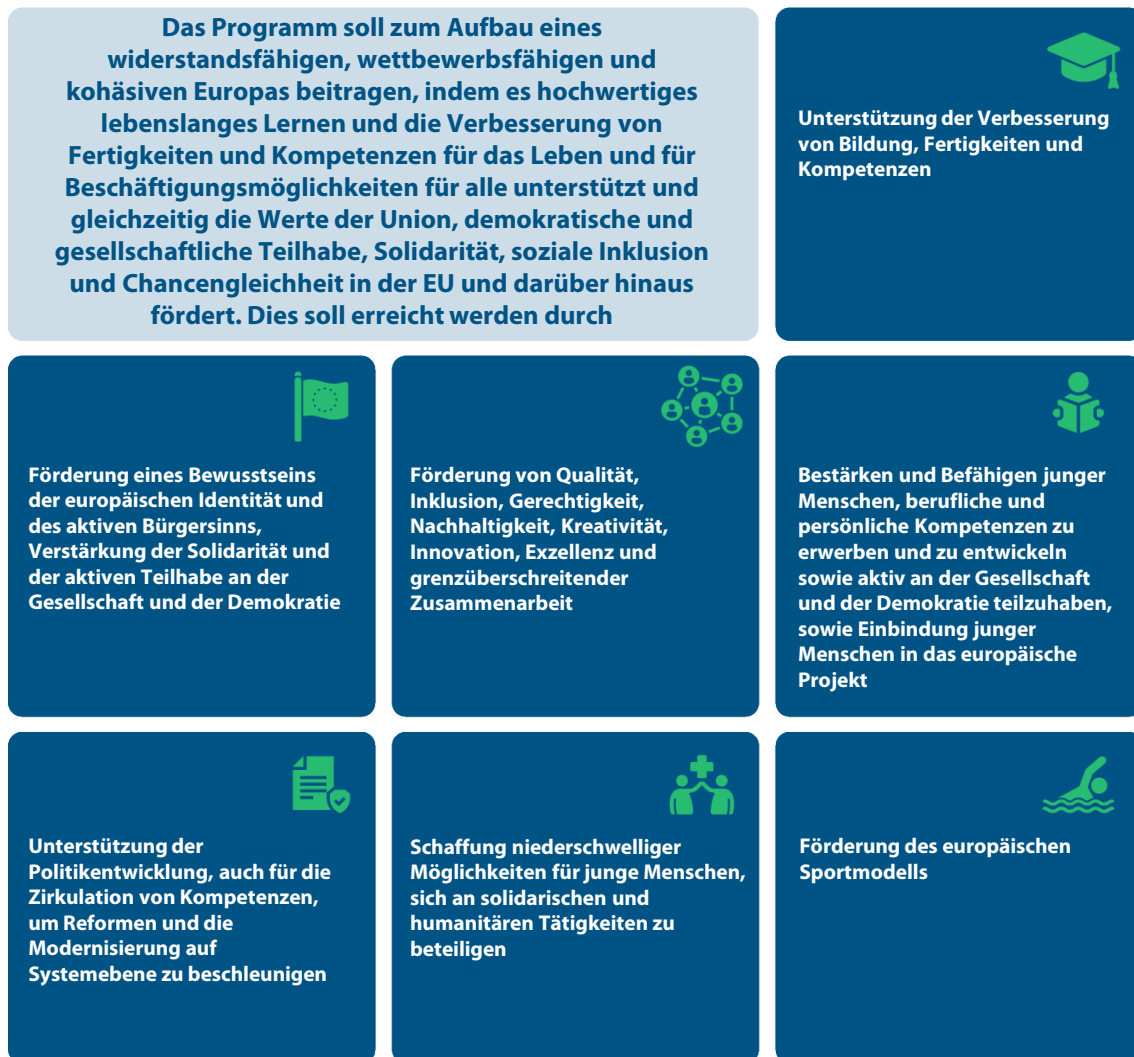
Abbildung 1 | Allgemeines Ziel und Einzelziele des Vorschlags zu Erasmus+