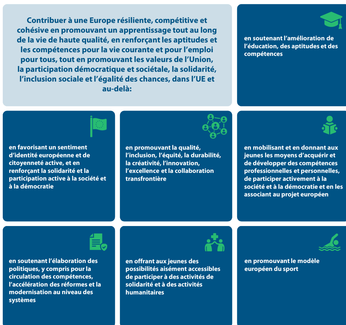
Figure 1 | Objectifs généraux et spécifiques de la proposition relative à Erasmus+