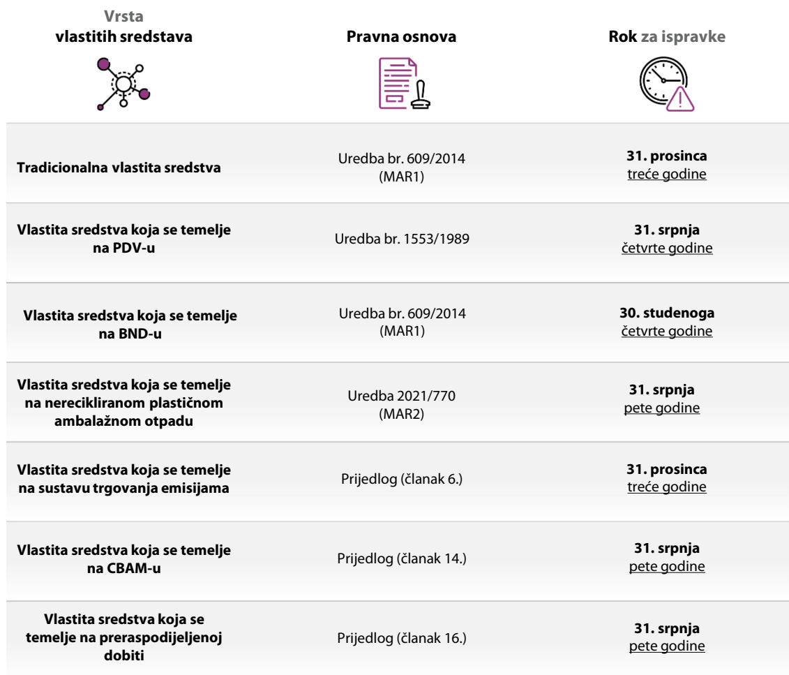
Tablica 1. – Rok za ispravke (nastup zastare) za različita vlastita sredstva