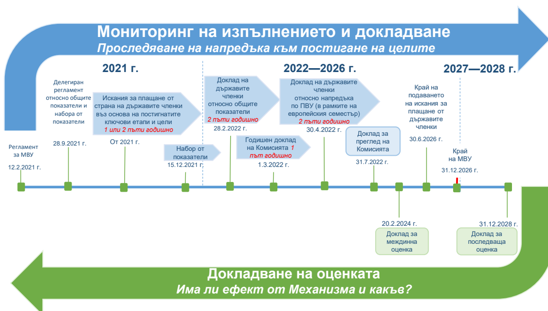
Фигура 3 — Мониторинг и оценка на изпълнението на МВУ за периода 2021—2028 г.