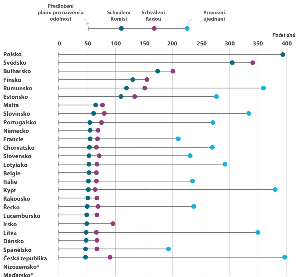
Obrázek 2 – Doba mezi předložením plánů pro oživení a odolnost a podpisem provozních ujednání

* Maďarsko a Nizozemsko předložily své plány pro oživení a odolnost teprve nedávno a Komise je stále posuzuje.