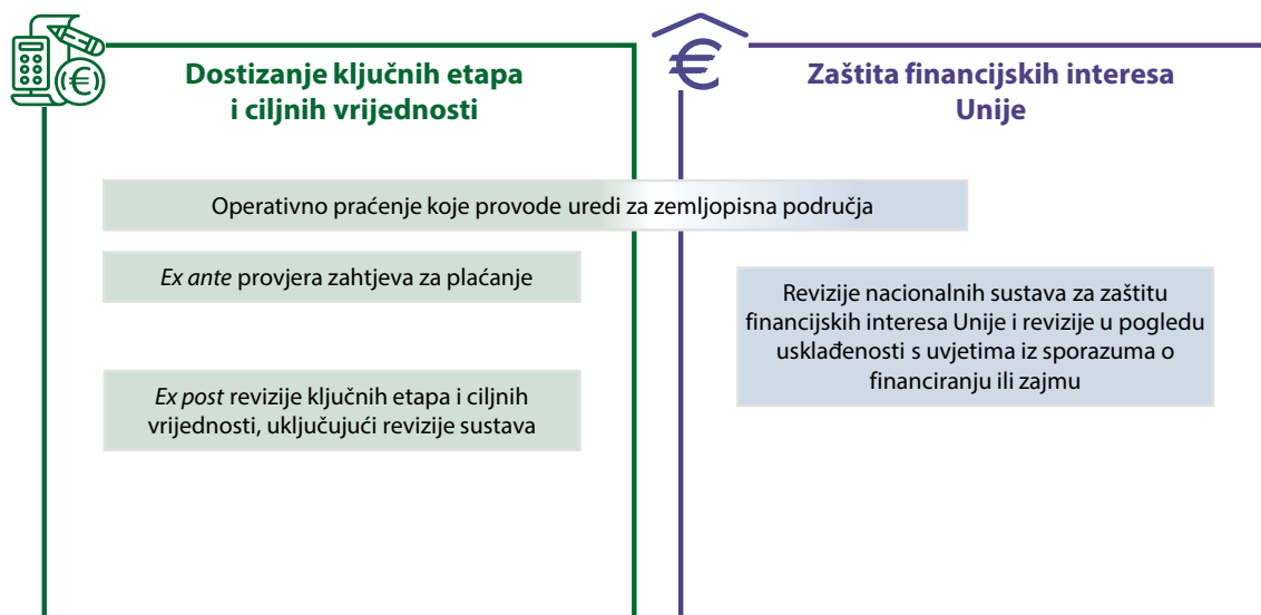
Slika 2. – Elementi Komisijina sustava kontrole za RRF