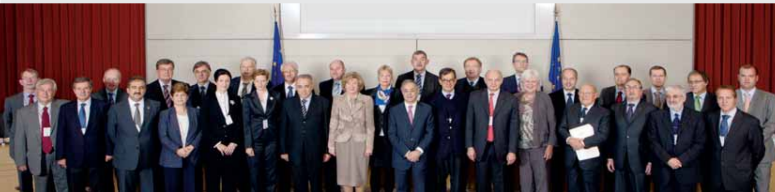
Yhteykskomitean vuoden 2011 kokous Luxemburgissa 13.–14. lokakuuta

Yhteykskomitea aikoo kehittää näitä toimia nykyisissä verkostoissaan, jotka kattavat Eurooppa 2020 -tarkastuksen ja finanssipolitiikan; toiminnassa hyödynnetään myös rinnakkaistarkastuksia tai koordinoituja tarkastuksia sekä muita tähän tarkoitukseen luotavia yhteistyömuotoja.