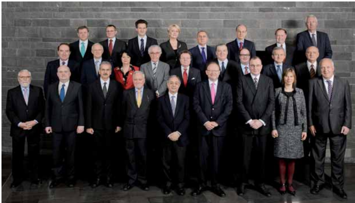
Euroopan tilintarkastustuomioistuimen jäsenet

Nykyisen, vuonna 2012 päättyvän strategian perusteella käynnistettiin vuonna 2011 uuden strategian laadinta. Tilintarkastustuomioistuin tarttuu tilaisuuteen mukauttaa strategiaansa EU:ssa ja tarkastusalalla vallitseviin kehityssuuntauksiin ja vastata sidosryhmiensä tarpeisiin ja odotuksiin.