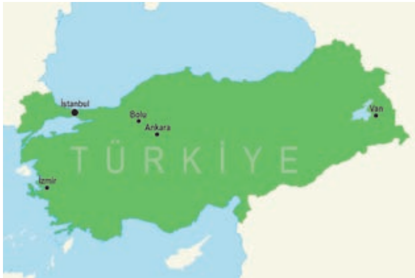
Turkki — Kartta tarkastuspaikoista