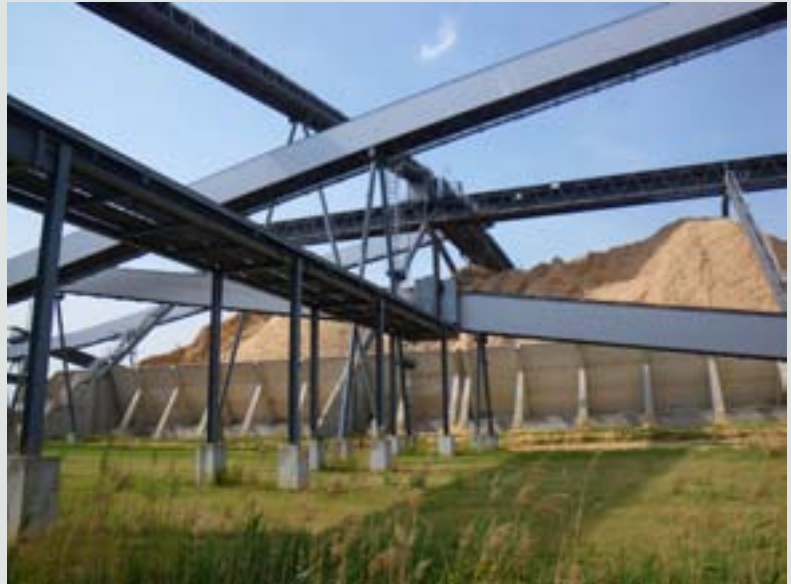
Ritratt 7 - Impjant taċ-ċelluloża fuq is-sit ta' dak li qabel kien impjant tal-enerġija nukleari ppjanat (Arneburg, il-Ġermanja)

F'dik li qabel kienet minjiera miftuħa tat-tidwib tal-metall għall-forma (Rotherham, UK), is-sit ġie riġenerat minn sħubija pubblika-privata. L-art li ġiet ikkontribwita mill-imsieheb privat ġiet evalwata għal 30 % tat-total tal-ispiza tal-proġett, u x-xogħlijiet ta' riġenerazzjoni li kellhom jithallsu mill-imsieheb privat ġew stmati għal 70 %. Madankollu, meta nbiegħu l-ħbula art, 70 % tad-dħul ġew allokati għall-imsieheb privat u 30 % għall-imsieheb pubbliku. B'dan il-mod, ingħata vantaġġ lill-proprjetarju privat, haġa li ma kinitx konformi mal-iskema applikabbli ta' għajnuna mill-Istat.