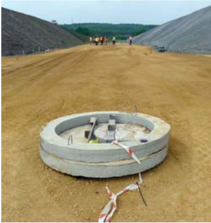
Ritratt 4 – Toroq u installazzjonijiet ta' utilitajiet qeghdin jinbnew fuq is-sit ta' dawk li qabel kienu munzelli gagazza (Jaworzno, il-Polonja)