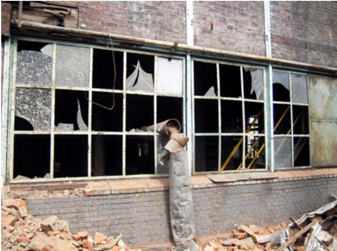
Ritratt 8 - Binjiet qodma qegħdin jitwaqqgħu u jiġu rinnovati f'impjant elettriku mitluq li qiegħed jiġi kkonvertit f'centru tal-arti u l-kultura (Łódź, il-Polonja)