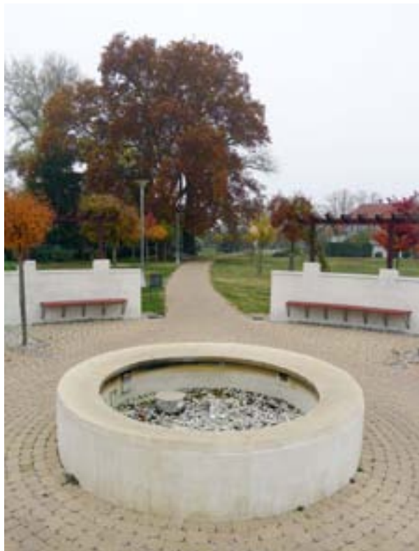
Ritratt 5 – Park municijali fuq is-sit ta' dik li qabel kienet fabrika tal-batteriji fejn twettqu xogħlijiet ta' dekontaminazzjoni u nbnew faċilitajiet ta' park (Marcali, l-Ungerija)