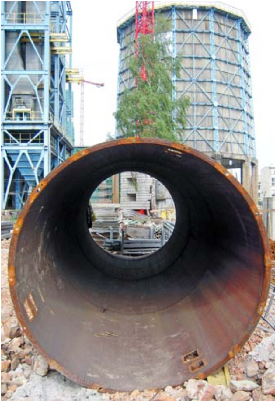
Ritratt 1 – Rinnovament u konverżjoni ta' torri ikoniku fiċ-ċentru ta' belt ġo impjant elettriku mitluq li qiegħed jiġi kkonvertit f'ċentru tal-arti u l-kultura (Łódź, il-Polonja)