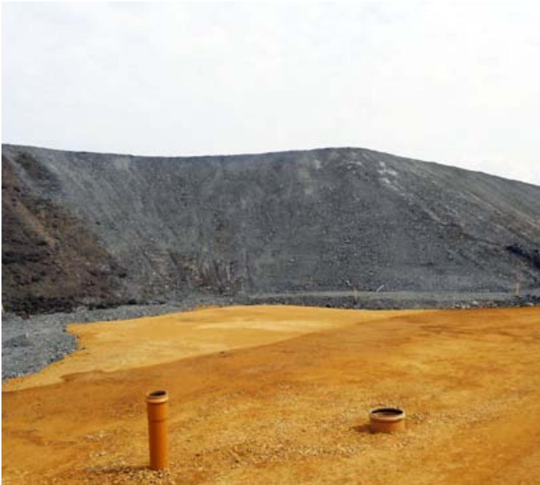
Ritratt 10 – Art imhejjija għall-konstruzzjoni ta' infrastruttura tat-toroq fuq is-sit ta' dawk li qabel kienu munzelli gagazza (Jaworzno, il-Polonja)